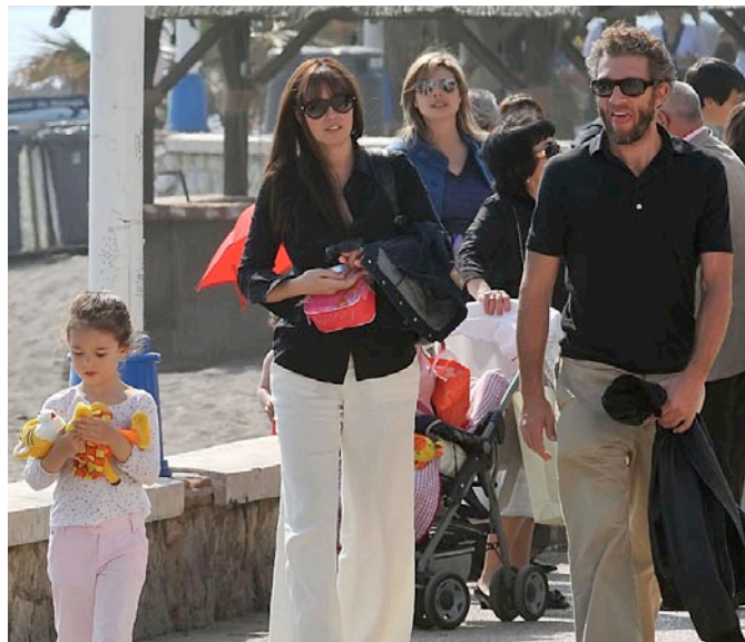
Familienglück: Monica Bellucci mit Töchterchen Deva, 6, und Ehemann Vincent Cassel, 43, im Malaga-Urlaub. Im Mai 2010 kam die zweite Tochter Léonie zur Welt

Älter zu werden ist für sie also wirklich kein Problem? Für Sekunden wirkt die Signora fast ein wenig melancholisch. Dann aber fängt sie sich wieder. Natürlich schreie sie nicht laut Hurra, wenn sie neue Falten in ihrem Gesicht entdecke. Trotzdem sei das Altern für sie vor allem eine spannende Erfahrung: „Man muss einfach lernen, sich mit den un schönen Folgen der Schwerkraft zu arrangieren. Niemand kann diesem Prozess dauerhaft entkommen. Deshalb sollte sich jeder lieber der Realität stellen, anstatt an sich herumschneiden zu lassen.“