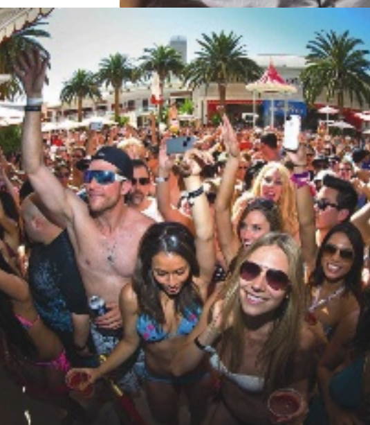
Musik für die Massen: Wenn Big Player der Szene wie Calvin Harris (o.), David Guetta und Tiësto (r.) zum Tanz aufspielen, dann strömen Tausende, weltweit. In den USA zahlen Fans für ein Ticket bis zu 150 Dollar – Hauptsache sie können ihre Idole live erleben