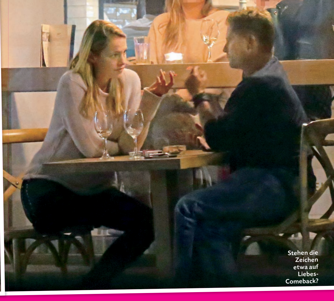
Stehen die Zeichen etwa auf Liebes-Comeback?