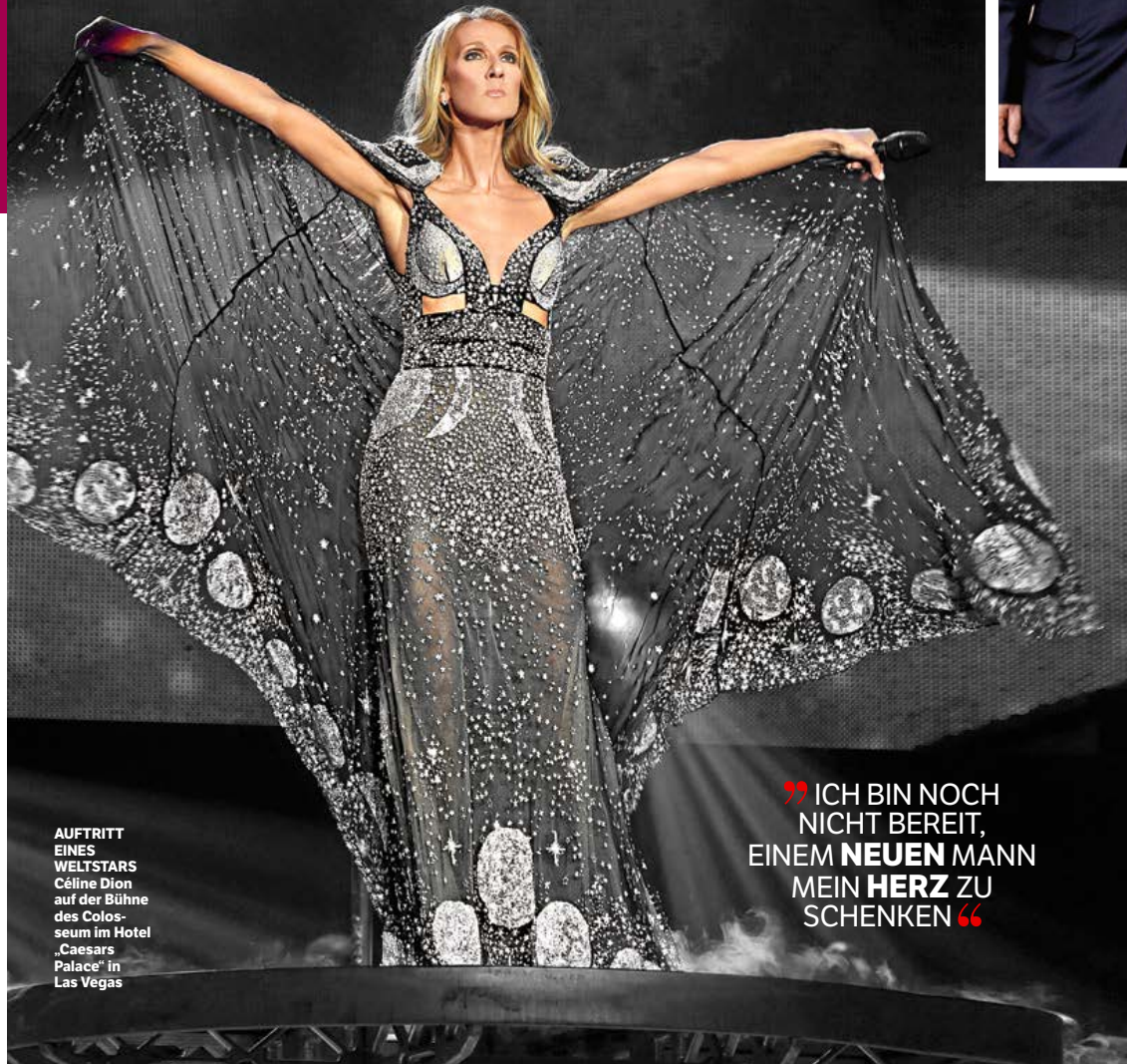
AUFTRITT EINES WELTSTARS Céline Dion auf der Bühne des Colosseum im Hotel „Caesars Palace“ in Las Vegas

„ICH BIN NOCH NICHT BEREIT, EINEM NEUEN MANN MEIN HERZ ZU SCHENKEN“